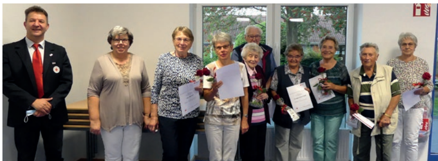
24.08.21 DRK Riede-Felde JHV