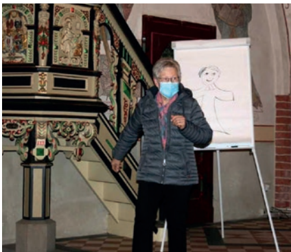
Montagsmaler in der Andacht: Für ein eingefleischtes Team kein Problem!

Frauen zu einem geselligen Kreis zusammenfinden - vielleicht ein Stammtisch der Konfi-Eltern?