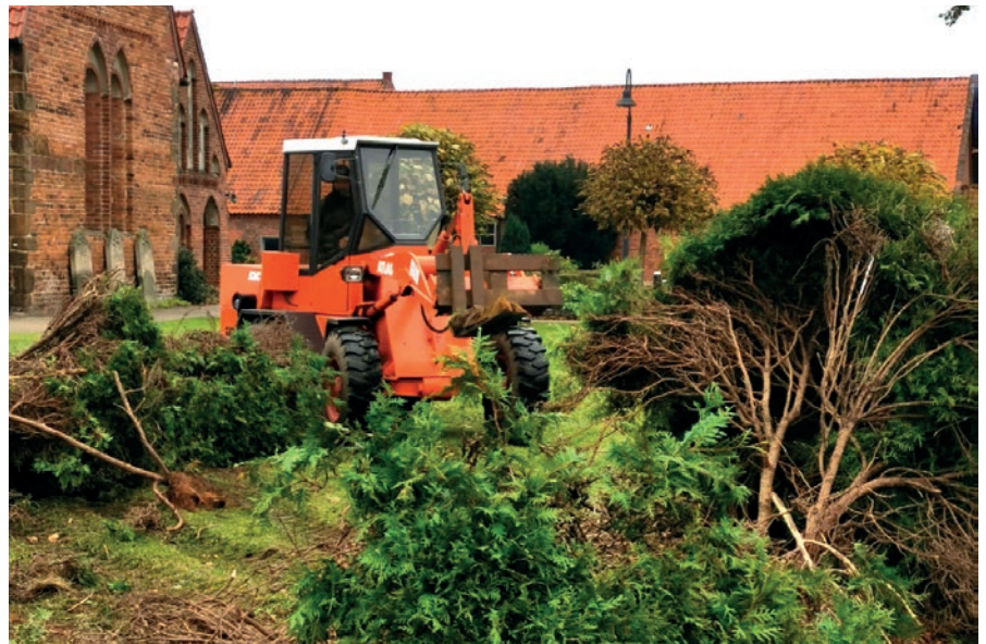
Der Anfang ist gemacht

Wenn Sie in letzter Zeit über den Friedhof gegangen sind, haben Sie sicher einiges Neues entdeckt. Die Zeiten haben sich geändert, der Friedhof wird vielfältiger. Neben den klassischen Familiengrabstellen finden sich immer mehr Urnengräber, vor allem, solche, die nicht mehr durch Angehörige gepflegt werden müssen. Der Friedhof ist ein Spiegel der Gesellschaft: Mit den Lebensformen ändern sich natürlich auch die Bestattungsformen. Mittlerweile ist die dritte Urnen-Gemeinschaftsanlage fertiggestellt, und auch eine zweite Anlage mit Partner-Urnengräber ist entstanden. Damit reagieren wir auf das große Interesse an diesen Arten der Beisetzung. Eine Grabstätte für Erdbestattungen mit geringem Pflegeaufwand entwickelt der Friedhofsausschuss gerade.