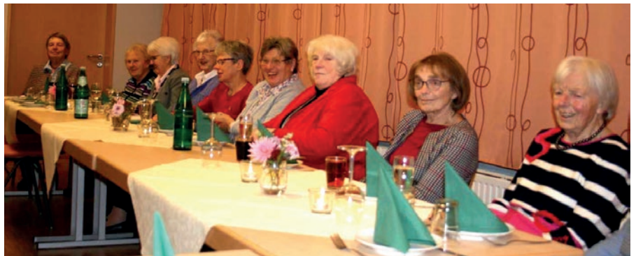
Im Gemeindehaus gab es anschließend viel zu erzählen