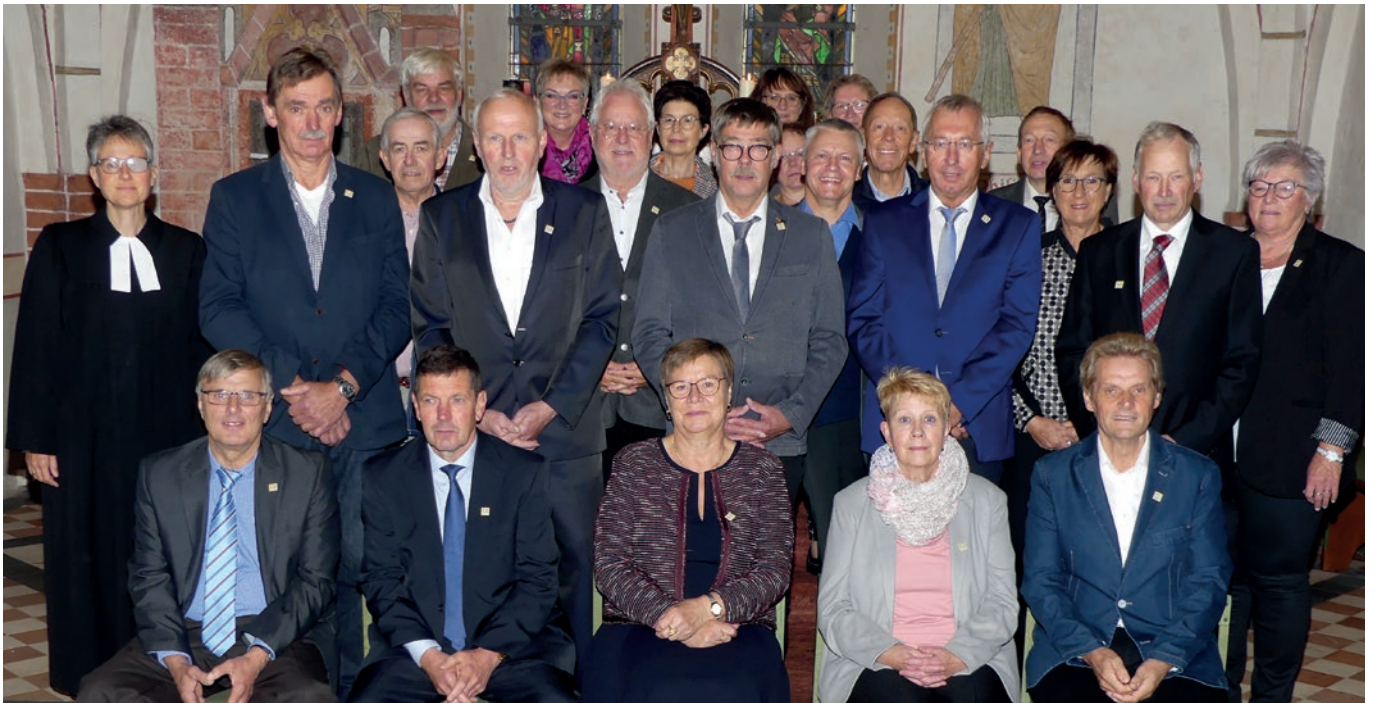
10.10.21 Kirche Riede goldene Konfirmation