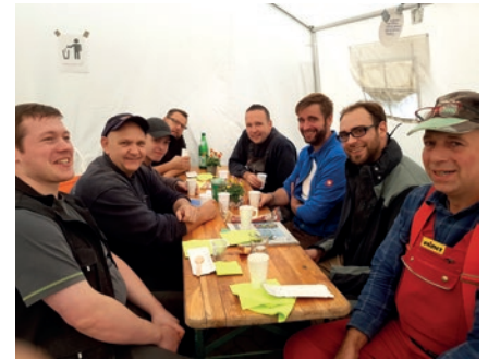
Die Mittagsrunde in einem der Verpflegungszelte die in allen Ortschaften stehen. Hier können Helfer und Betroffene täglich Mahlzeiten zu sich nehmen, die alle über Spenden organisiert werden.