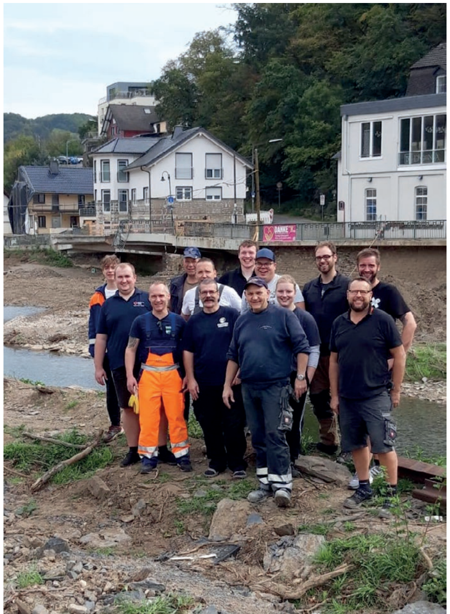
Ein Gruppenfoto an der „Ahr“ zum Abschluss des Wochenendes mit den Freunden der Langwedeler FW, die auch immer wieder solche Aktionen starten.

Aber mit Hilfe vieler Menschen und Aktionen, wie unserer, geben wir den Menschen dort die Hoffnung, dass es zu schaffen ist. Die Dankbarkeit der Betroffenen ist so überwältigend, sie gibt jedem Kraft, sowie ein lachendes Herz zurück. Unsere Aktion, die wir auf privater Basis durchgeführt haben, wurde von der Firma BSG Sandhandel