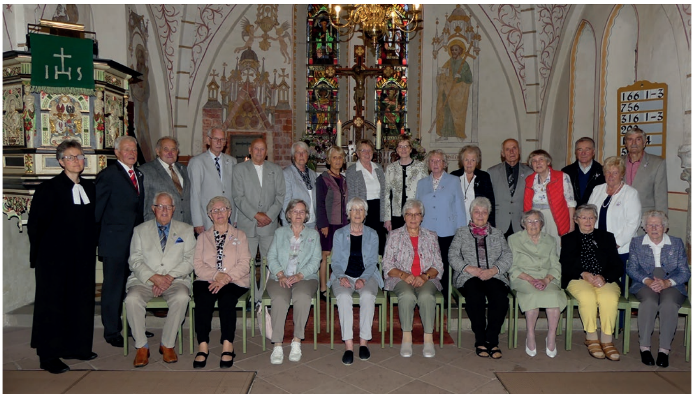
08.08.21 Eiserne-Konfis Riede