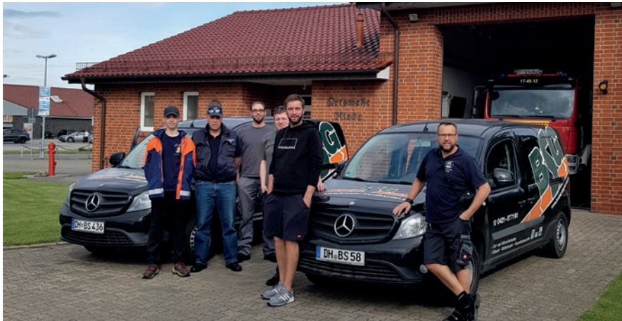
Vor dem Start ins Arbeitswochenende am FW Gerätehaus in Riede.