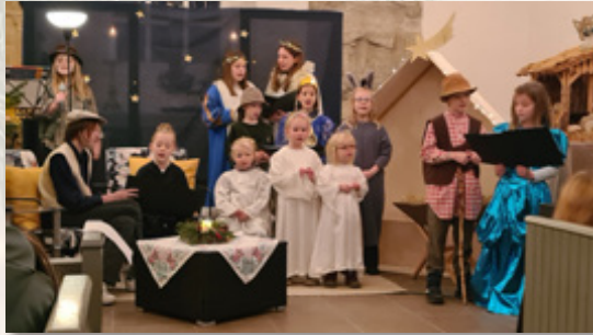
Polle - Foto: C. Runge