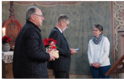
Text: E. Ruppert / Foto: R.Kirko

sen. Beim wöchentlichen Aufziehen der Turmuhr, beim Laubfegen im Herbst und beim Aufstellen des Weihnachtsbaumes wurdest du von deinem Ehemann unterstützt. Der Kirchenvorstand Halle bedankt sich herzlich für deinen langjährigen Einsatz und wünscht dir und deiner Familie für die Zukunft alles Gute, Gesundheit und Gottes Segen.