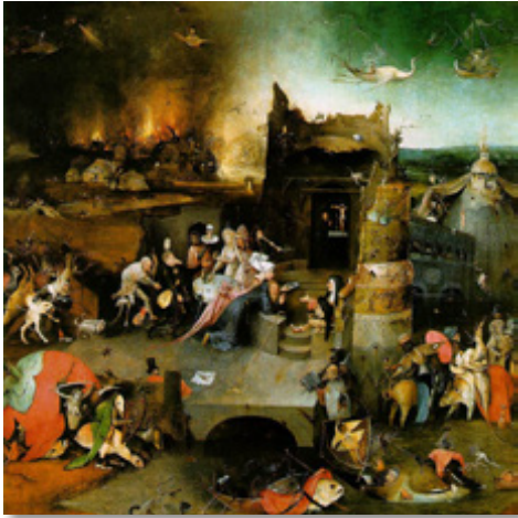
Bild: Die Versuchung des Heiligen Antonius von Hieronymus Bosch (Museu Nacional de Arte Antiga, Lissabon)

Wie war das zu Boschs Zeiten noch einfach und übersichtlich. Die Versuchung lauerte einem als Teufel, Hexe oder Verführerin auf, und wenn man sich fernhielt oder ihr widerstand, war einem das Paradies sicher. Das Böse war in der Außenwelt und sehr leicht als solches zu erkennen. Wahrscheinlich war selbst die Welt im Mittelalter etwas komplexer, unsere heutige moderne ist es mit Sicherheit. Zum einen wissen wir spätestens