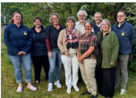
Das Team der Notfallseelsorger:innen (2025)

Im Kirchenkreis Holzminden-Bodenwerder wurden im Jahr 2025 insgesamt 64 Einsätze gezählt, davon mehr als 3/4 im innerhäuslichen Bereich. Der Kirchenkreis Holzminden-Bodenwerder hat eine wachsende Anzahl von Notfallseelsorger:innen,