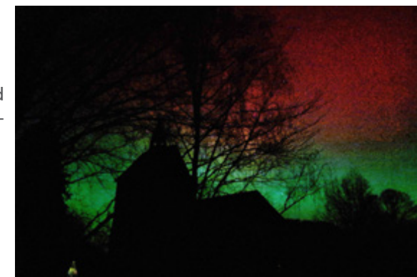
Text: A. Meier

Nordlichter nicht nur in Lappland – sondern: auch über der St. Michael Kirche in Kirchbrak.