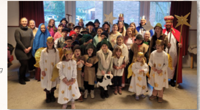
Kirchbrak - Das Foto zeigt die verkleidete Krippenspiel-Schar im Gemeindehaus Kirchbrak. Von hier ging es zur Generalprobe am 4. Advent und zur Aufführung am Heiligen Abend in die voll besetzte Kirche.