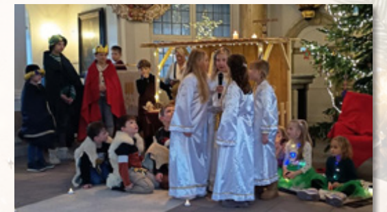
Hehlen - Ein herzlicher Dank an die große Schar, die für uns ein Licht in der Krippe war."