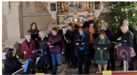
sikalischen Abend ausklingen. Sicher gibt es eine Neuauflage in diesem Jahr.

Das Konzert unter Leitung von Nelli Simonyan in der St. Michael-Kirche ist inzwischen fester Bestandteil der vorweihnachtlichen Zeit. Ob mit Keyboard, Querflöte, Solo- und Chorgesang sowie den besinnlichen Textbeiträgen – abwechslungsreicher geht es nicht. Allen Mitwirkenden ein herzliches Danke. Bei lockeren Gesprächen und mit selbst gebackenen Keksen ließen wir den mu-