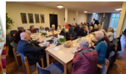
Gründonnerstag im Pfarrsaal