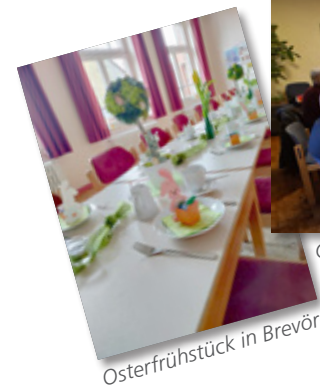
Osterfrühstück in Brevörde

und geselligem grüner Suppe essen finden sich im Pfarrsaal viele Gläubige zusammen.