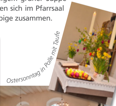
Ostersonntag in Polle mit Taufe