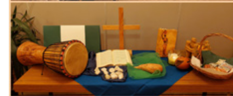
Weltgebetstag in Halle