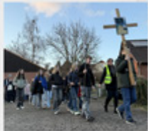
ÖKUMENISCHER JUGENDKREUZWEG IN POLLE