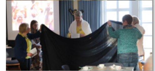
Weltgebetstag in Polle