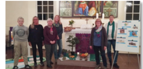
Weltgebetstag in Grave