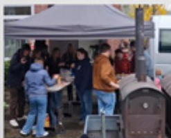
KIRCHENKREIS- JUGENDKONVENT IN LENNE

ALLE INFOS ZU UNSEREN ANGEBOTEN FINDET IHR AUF WWW.EVJU-HOBO.DE