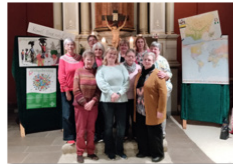
Weltgebetstag in Brevörde