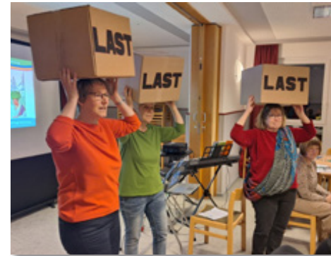
WGT-Team in Kirchbrak