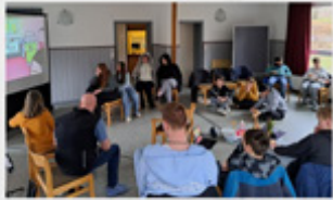
KONFI-BLOCKTAG ZUM THEMA ABENDMAHL