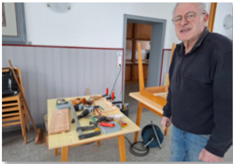
Text: S. Bächler

Der Kirchenvorstand dankt Herrn Kitter sowie allen Spendern ganz herzlich.